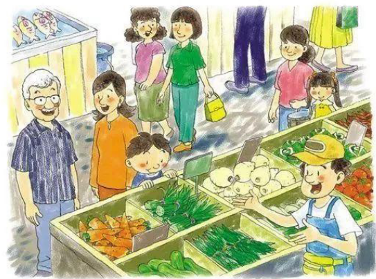
2C 李會迪 (黃社)