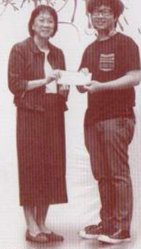
「芝麻羔」(Dreamerago)於周會分享夢想之旅，鼓勵同學發揮才能，擁抱夢想。