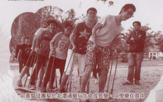
基督徒團契於北潭涌舉行生命成長營，同學樂在其中