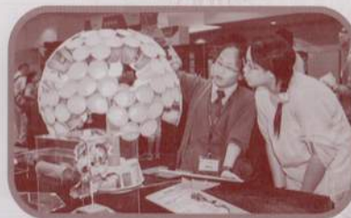
講解員向參觀的市民介紹本校的創意發明