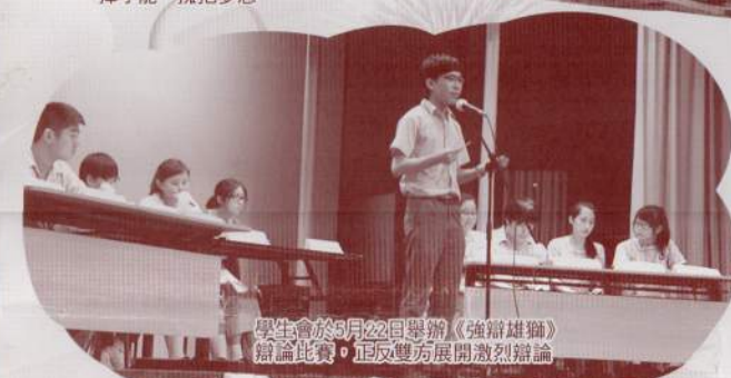
學生會於8月22日舉辦《強辯雄辯》辯論比賽，正反雙方展開激烈辯論