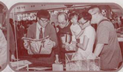
講解員向參觀的市民介紹本校的創意發明