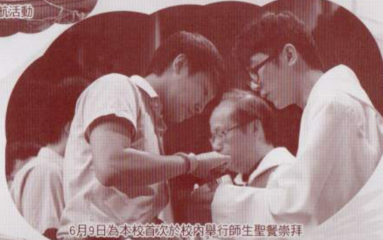
6月9日為本校首次於校內舉行師生聖餐崇拜