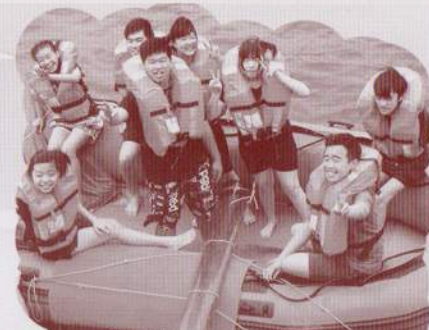
中二級的同学參與乘風航活動