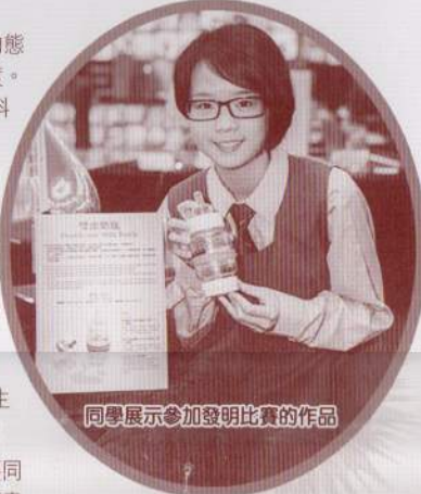
同學展示參加發明比賽的作品

多年來學校不斷努力，老師不辭勞苦，付出時間，付出心血，但看到學生的成就，令大家心感安慰。相信今次活動只是我們區內科學科技的交流的開始而已。我們希望藉此能夠誘發更多同學對科學的興趣，繼續研發探索，他日能為科學永續發展出一分力。