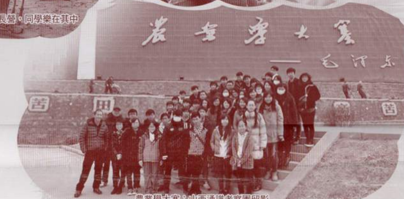
農業學大寨：山西通識考察團留影