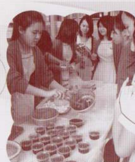
經濟學會於4月26日舉辦校園商體日，經濟科同學自製的食品非常受歡迎