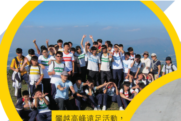
攀越高峰遠足活動，同學挑戰草山。