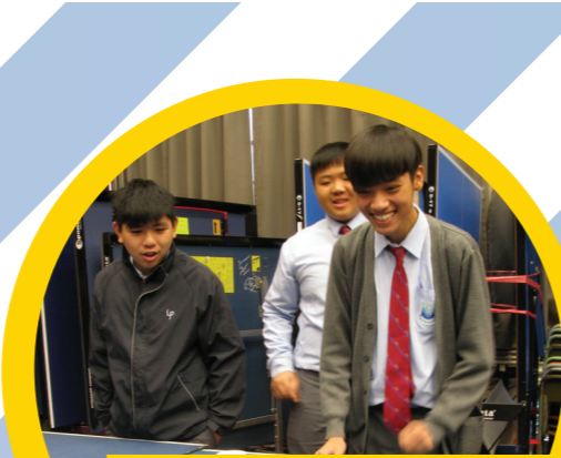
同學正參與中三級小遊戲挑戰賽。