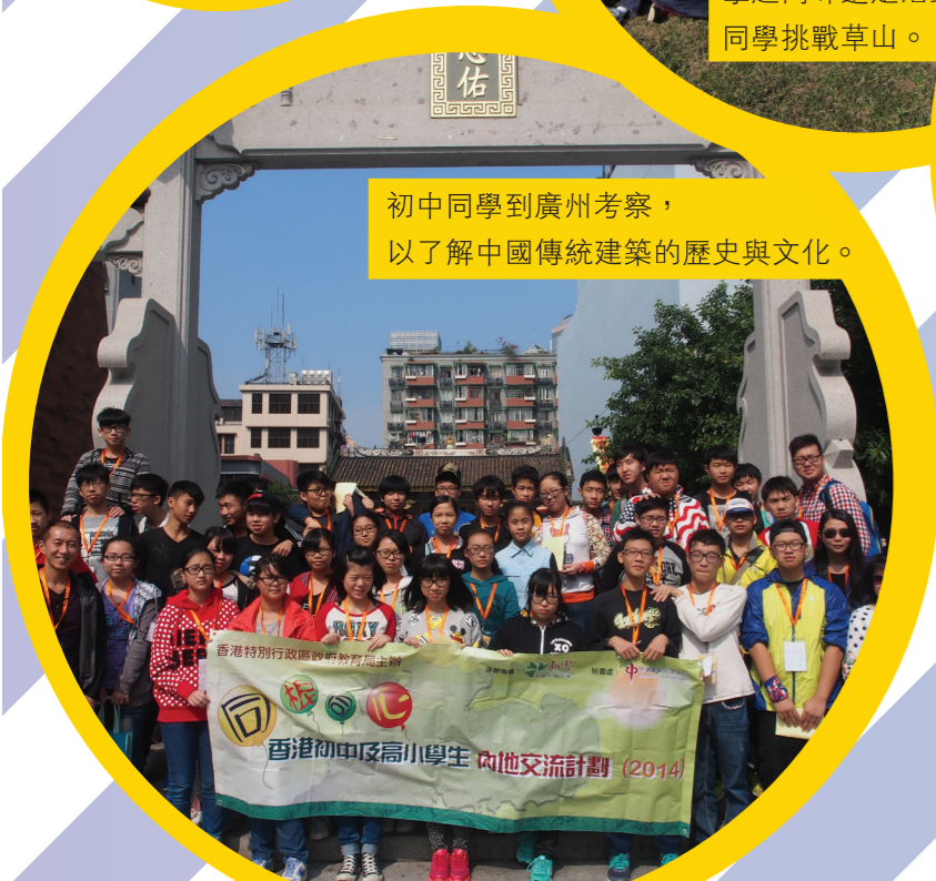
初中同學到廣州考察，以了解中國傳統建築的歷史與文化。