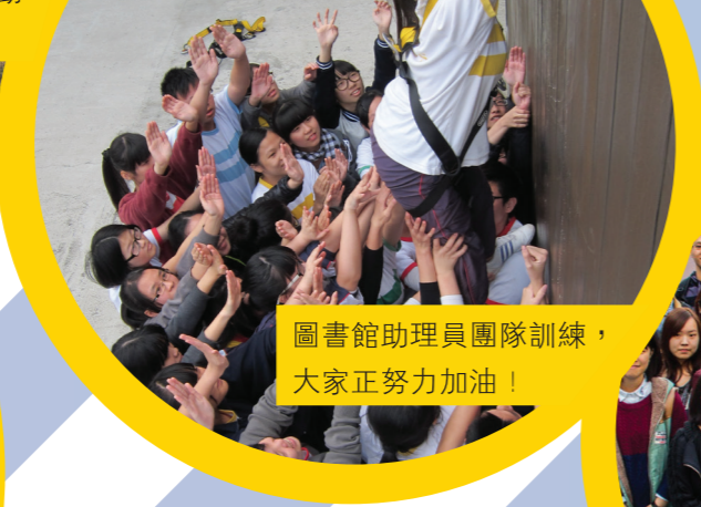
圖書館助理員團隊訓練，大家正努力加油！