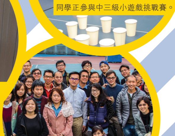
校友會本學年第一次會員大會。