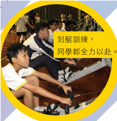
划艇訓練，同學都全力以赴。