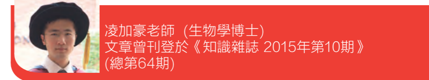
凌加豪老師（生物學博士） 文章曾刊登於《知識雜誌 2015年第10期》 (總第64期)

筆者認為活體器官捐贈存在風險，並不適合每個人，畢竟各人有家庭、事業、健康等種種因素考慮；相反，死後捐出器官卻合情合理，與其任由器官火化成灰，或蟲蛀腐爛，倒不如遺愛人間。去年底因哮喘病發死亡的13歲女童，家人捐出其肝臟及腎臟，分別救回一名七個月大嬰兒及三名瀕死病人，既延續了別人的生命，也為女童在世上留下一點「活著」的痕跡。器官捐贈是無償的捐獻，像贈送禮物一樣，學期完結時，我們行畢業禮都是高高興興，就讓生命完結時，行一個「生命·禮」(gift of life)，為人間帶來喜悅。