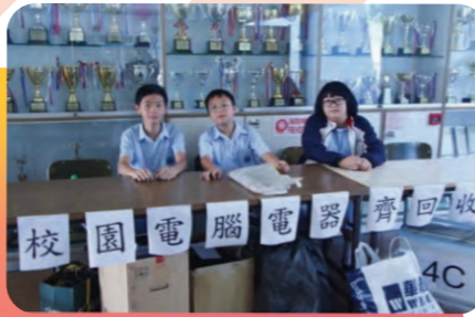
學校響應環保署的呼籲 在校內舉行電腦電器回收活動