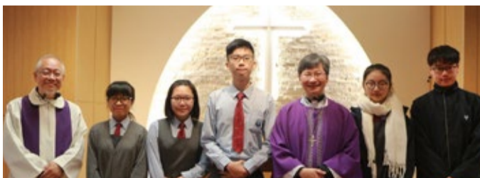
小聖堂重新裝修後, 於2018年3月21日由陳耀明主教主持奉獻禮