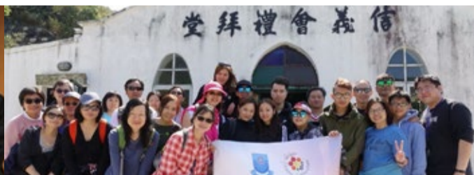
校友會於4月舉辦馬鞍山山活動